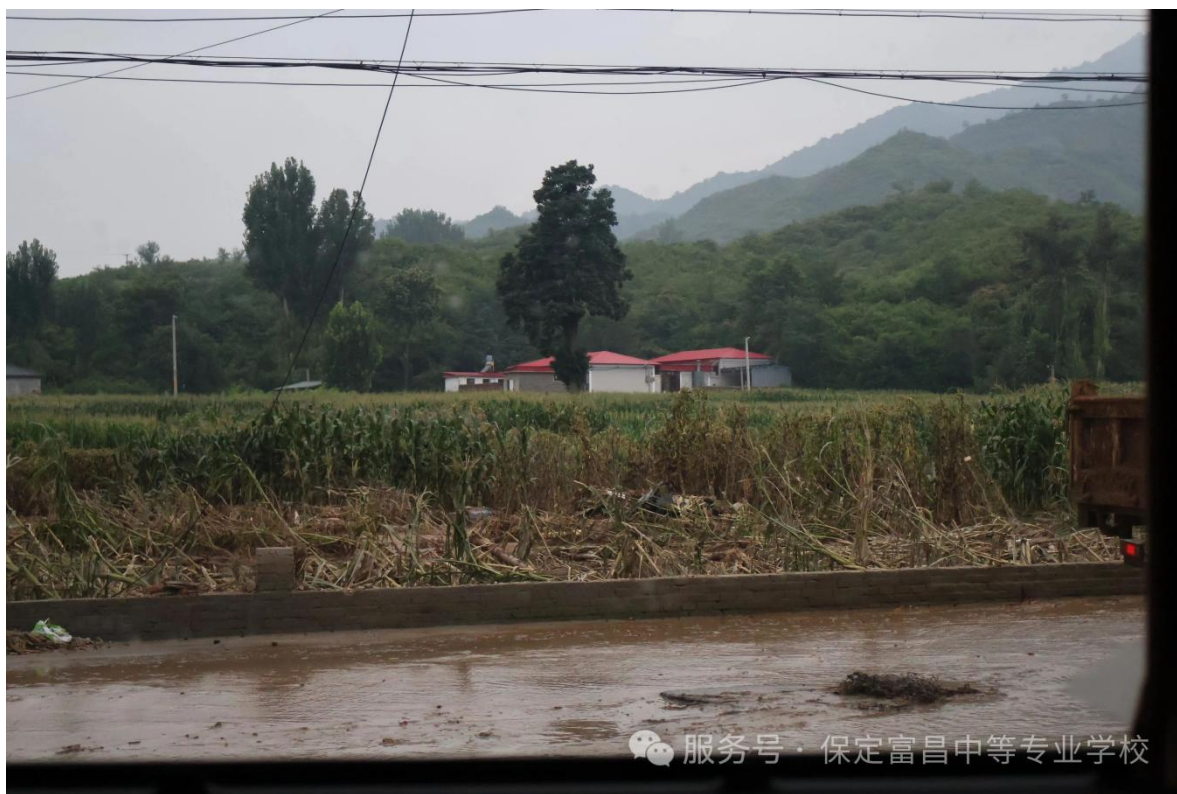
图9 阜平县受灾情况