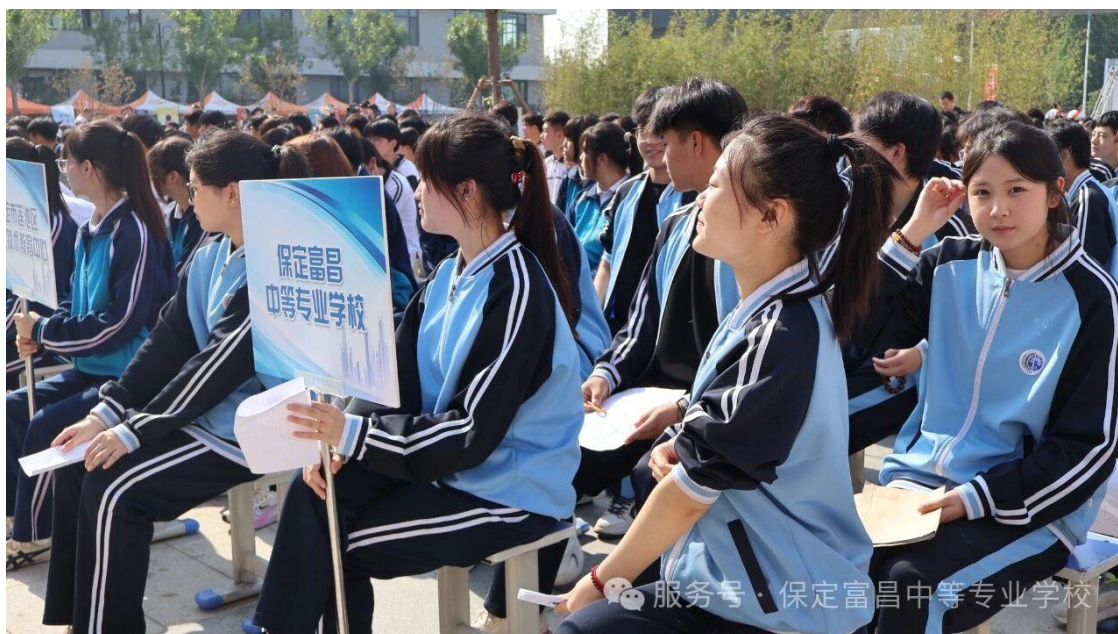
图 5 校园双选会现场