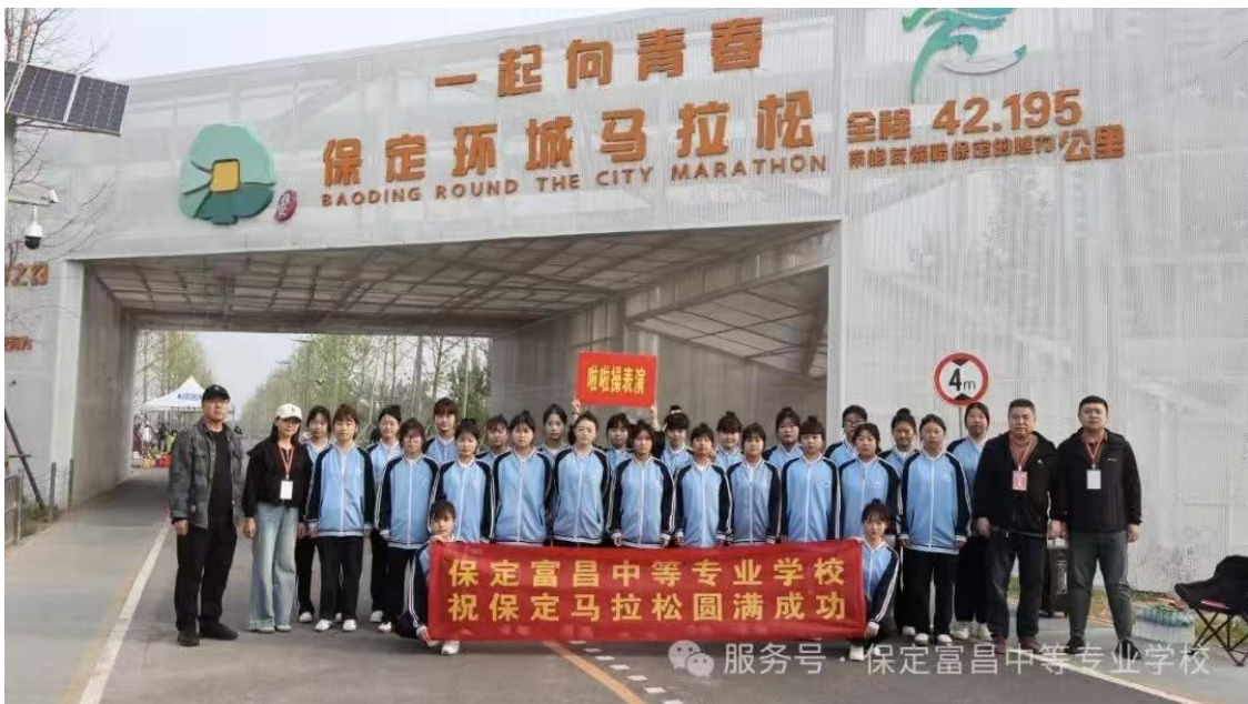
图 13 助力 2025 保定马拉松比赛