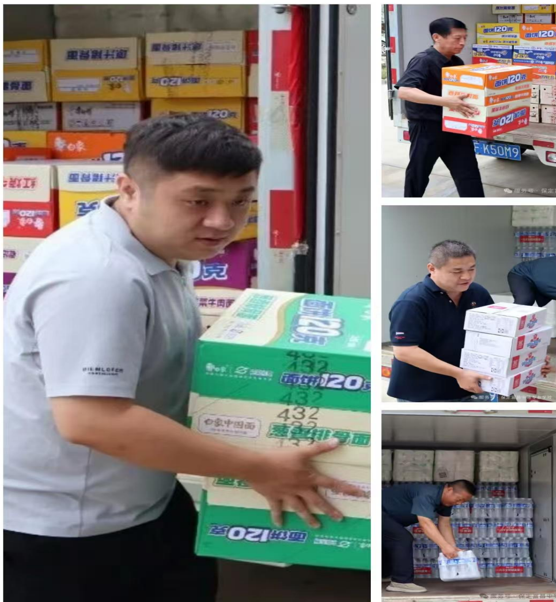
图 11 为阜平县灾区送去物资