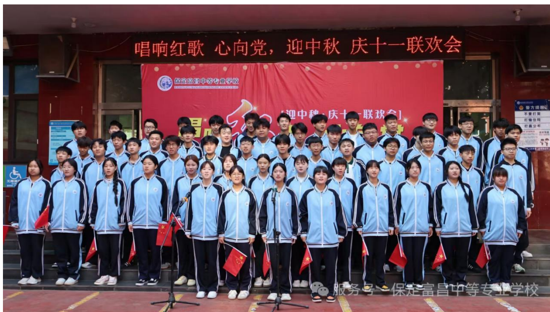
图 15 2025 年“十一红歌”