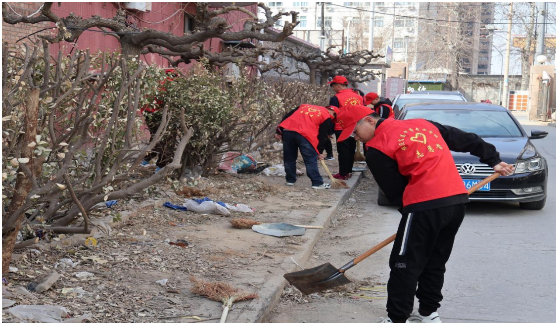
图 12 学习雷锋-清扫社区卫生