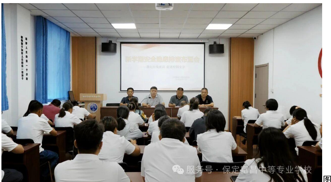
图 20 开学前准备工作部署

开展中职学校治理对于提升学校的教育教学质量、促进学校的可持续发展、满足社会对技能型人才的需求、增强学校的社会责任感以及促进中职教育职业教育高质量发展都具有重要的意义。