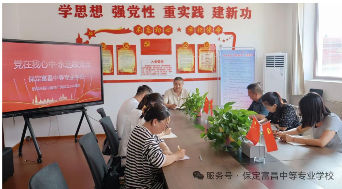
图2 党支部书记上党课

到“两个维护”，在学懂、弄通、做实上下功夫，往深里学、往心里学、往实里学，切实用习近平新时代中国特色社会主义思想武装头脑、指导实践、推动工作，推进新思想落地生根，进一步加强日常学习督查。推进“两学一做”学习教育常态化制度化建设，举办中层干部培训班，建强干部队伍。聚焦学校发展奋斗目标，凝聚干事创业的巨大合力，确保学校各项事业健康稳定高质量发展。落实习近平新时代中国特色社会主义思想和党的二十大精神进教材、进课堂、进头脑，筑牢了意识形态领域阵地。