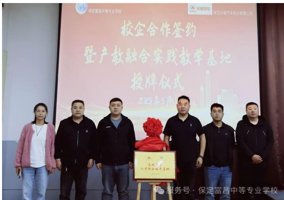
图 19 学校与长城汽车公司校企合作签约

为保证校企合作，产教融合工作的顺利开展，学校不断加强对教师的培训，选派骨干教师参加省级及国家级培训，进一步提高了教师整体素质和业务水平。同时，企业选拔技术精湛、品德高尚的资深技术人员担任企业导师，承担学徒在企业实习期间的岗位技能培训、实践操作指导以及职业素养培育。双导师分工协作、定期沟通交流，共同制定学徒培养计划、考核标准，为学徒成长成才保驾护航。