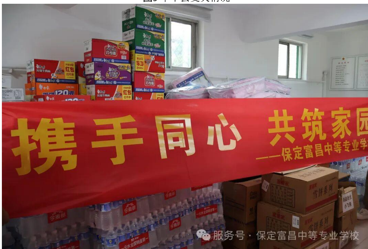
图10 为阜平县灾区准备物资