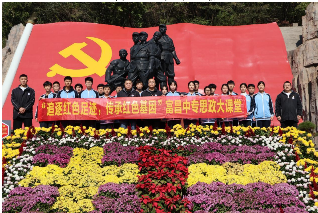
图 16 思政大课堂---狼牙山