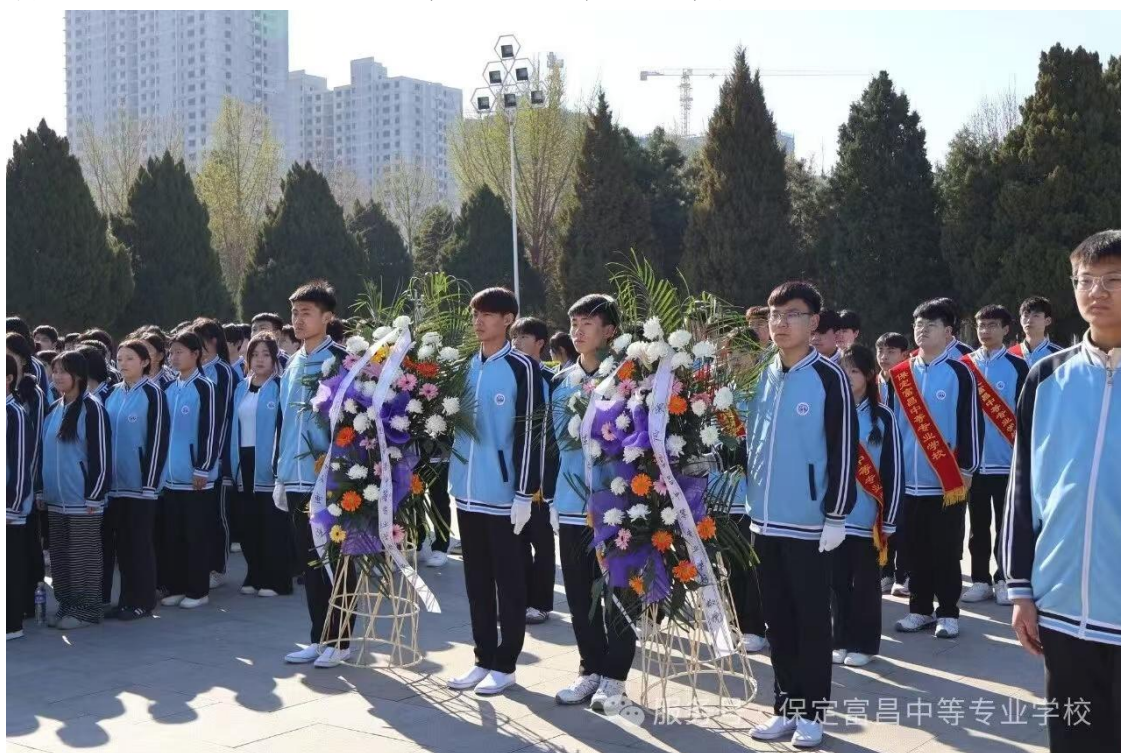
图 17 2025 清明节在保定市烈士陵园扫墓

学校开展了硬（软）笔书法比赛等活动；开展每月一主题的学生绘画、书法作品展；每逢传统佳节，举行特定的活动，例如在清明节组织烈士陵园扫墓活动，端午节则开展“品香粽”为主题的活动，传承区域优秀传统文化。