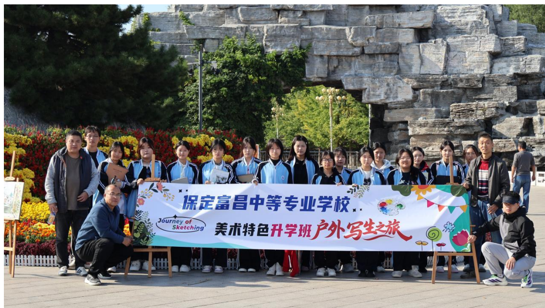
图 4 美术社团户外写生

学校成立了美术社团、舞蹈社团、电工电子社团等社团组织，由学校德育处和团委牵头，每个社团组织安排了指导老师，每周在固定的场所开展社团活动，德育功能贯穿于每项活动始终，挖掘其“仪式感强、教育意义大”的德育价值，强化学生养成良好的行为习惯，引导学生“扣好人生第一粒扣子”，大大丰富了校园文化生活，提高了学生组织、领导活动等方面的能力。