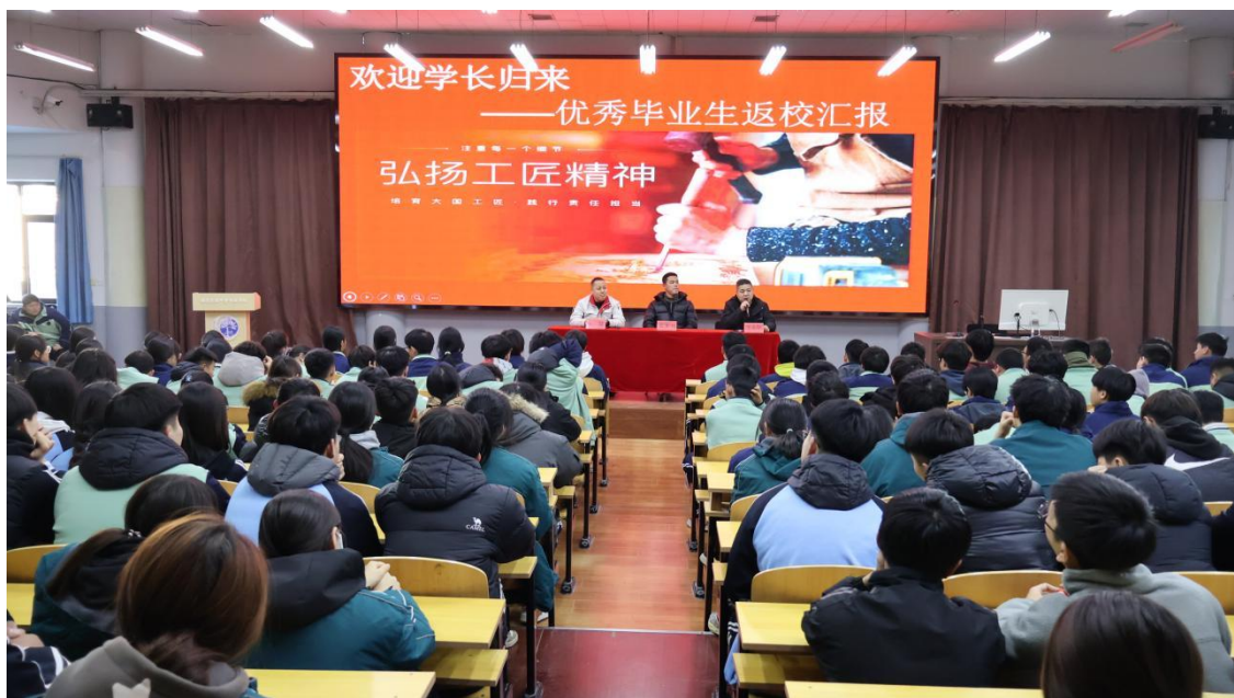
图 14 优秀毕业生返校汇报-弘扬工匠精神