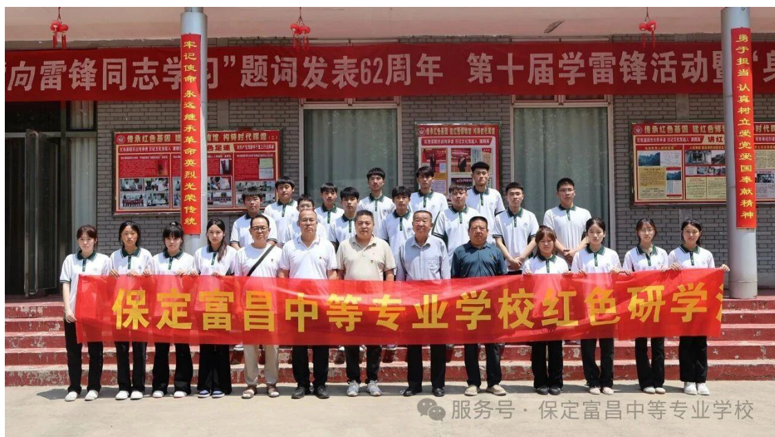
图 18 中国共产党日记博物馆的研学活动