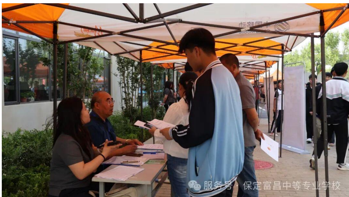
图 6 毕业生向用人单位咨询