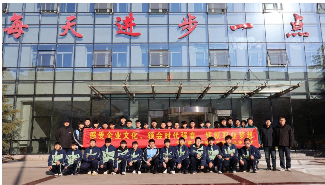
图 7 长城汽车实习

学校积极对接行业企业，开展校企合作，与该校合作的本地企业有：长城汽车股份有限公司，到企业开展企业实践、实习见习等活动，企业定期接受学生在其单位参加实习，2025年度累计提供实习岗位100人次，在一定程度上提高了学生的专业技能水平和提高学校教育教学质量。